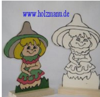
Pilzmädchen P100-08250 18x12x0,4 3,00€