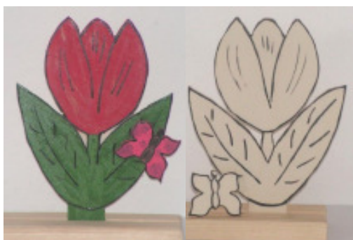
Tulpe mit Schmetterling P203-04250 16x12x0,4 3,00€