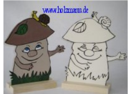
Pilz P102-08250 16x14x0,4 3,00€