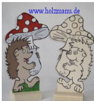
Igel mit Pilz P105-06250 17x10x0,4 3,00€