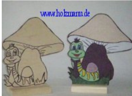
Pilzhaus mit Wurm P101-08250 15x14x0,4 3,00€