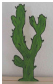
Kaktus P204-06150 21x12x0,4 2,00€