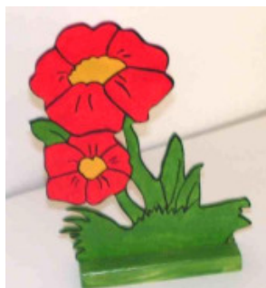
Blume P201-12250 18x14x0,4 3,00€