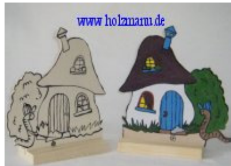
Pilzhaus P106-10250 14x13x0,4 3,00€