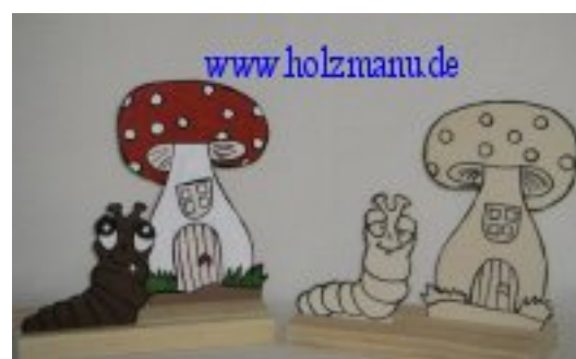
Pilzhaus mit Wurm P108+T400-20350 13x20x0,4 4,50€

Die Preise beziehen sich auf die ausgeschnittene, vorgemalte, Holzfigur und den passenden Ständer (H = Figuren zum Aufhängen). Weitere Informationen zu Liefermöglichkeiten (Sonderwünsche und Größen) am Ende des Kataloges.