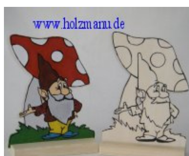
Pilz mit Zwerg P103-12250 15x11x0,4 3,00€