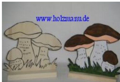
Pilze Steinpilz P110-14250 12x14x0,4 3,00€