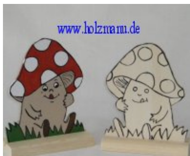
Pilz P109-12250 14x12x0,4 3,00€