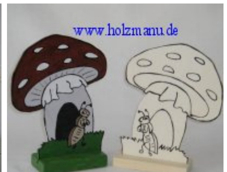
Pilzhaus mit Käfer P104-08250 17x13x0,4 3,00€