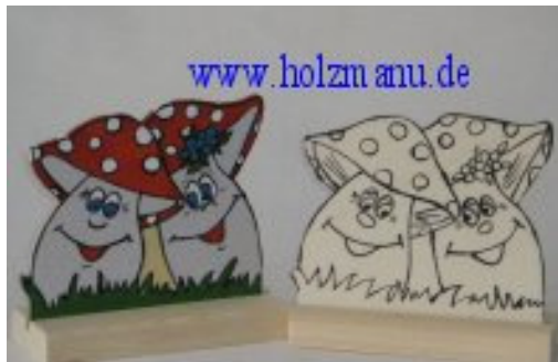
Pilz Paar P107-12250 10x12x0,4 3,00€