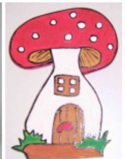
Pilzhaus P108-10200 10x13x0,4 2,50€