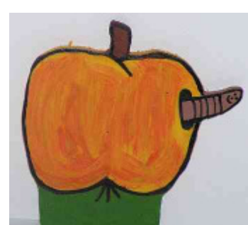
Apfel mit Wurm P001-04100 7x7x0,4 1,50€

Die Preise beziehen sich auf die ausgeschnittene, Vorgemalte, Holzfigur und den passenden Ständer (H = Figuren zum Aufhängen). Weitere Informationen zu Liefermöglichkeiten (Sonderwünsche und Größen) am Ende des Kataloges.